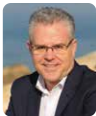
Pere Granados Alcalde de Salou